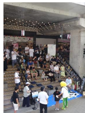
《古着ンピック2025 実施の様子》