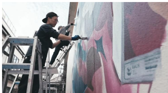
《MURAL MEDIA@ミカン下北 での過去のライブペイントの様子》