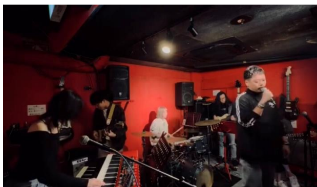
《セッションのイメージ》