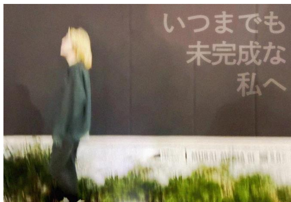
《いつまでも未完成な私へ》