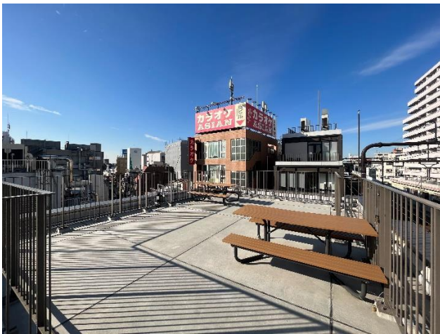
《ミカン下北B街区屋上》