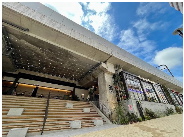
《ミカン下北A街区ダンダン》