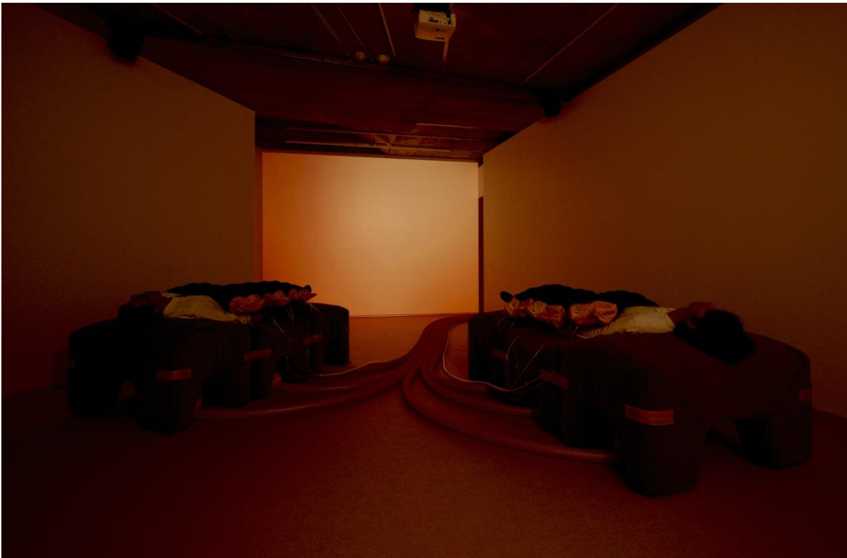
《Morph inn イメージ》