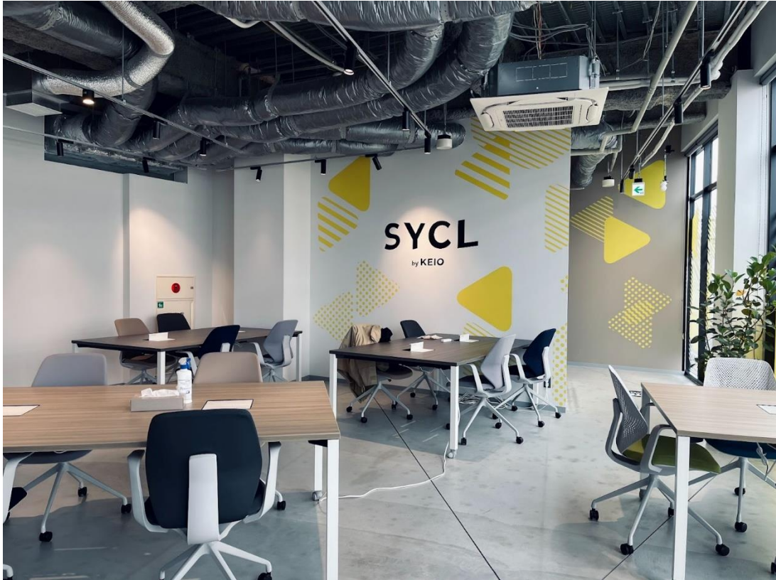
《SYCL by KEIO》