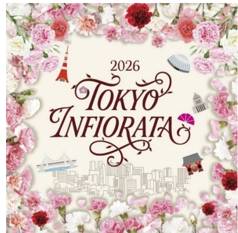
《東京インフィオラータ キービジュアルイメージ》