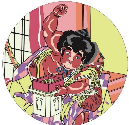
《インフィオーラータの原画》