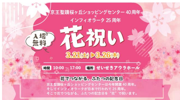
《花祝いキービジュアルイメージ》

当企画を通じて、京王聖蹟桜ヶ丘ショッピングセンター40周年とインフィオラータ25周年を祝うとともに、沿線からの誘客向上を目指してまいります。