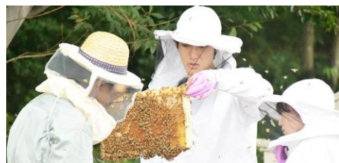
《みつばちプロジェクトの活動》