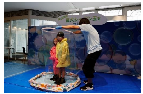
《2024年春のビールまつりの様子》