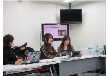
《オリジナルビールづくり ミーティング》