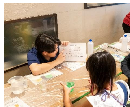
《Science Create Project の活動》

工学院大学の学生プロジェクト「Science Create Project」は、小学生を中心とした子ども向けの実験に関する教材開発に取り組み、学内外のイベントで実験を通して科学の面白さを伝える活動を行っています。2018年からみつばちプロジェクトとともに、ハチミツを使ったものづくりに挑戦。科学的な知見を活かした企画・提案、ラベルデザインの制作、広報活動などに協力しています。