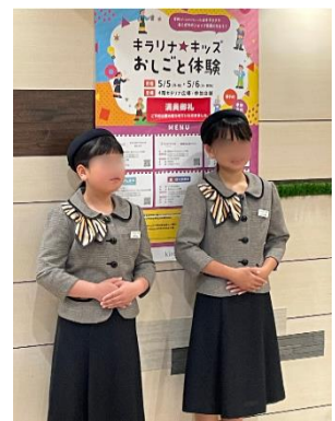
<<2025年開催風景「キラリナ インフォメーションのおしごと体験」>>