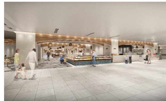
< B館2階リニューアルイメージ >

※現時点での設計に基づくものであり、今後の協議等により変更となる場合があります。