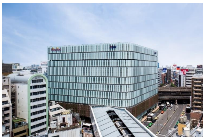
《キラリナ京王吉祥寺》